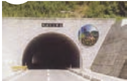
1996-1997 (平成8年～平成9年) 県道柳井周東線道路 (大江トンネル)改良工事