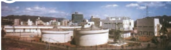
1982-1992 (昭和57年～平成4年) 小郡長谷終末処理場工事