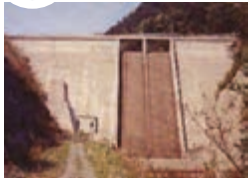
1979-1983 (昭和54年～昭和58年) 山の口ダム建設工事