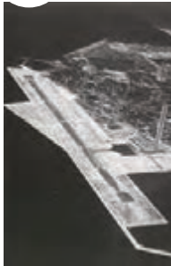
1966 (昭和41年) 空港整備事業