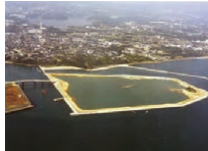
1988-2001 (昭和63年～平成13年) 山口宇部空港滑走路延長 (2500m) 工事