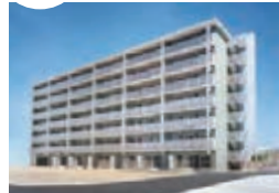
2000 (平成12年) 琴芝県営住宅