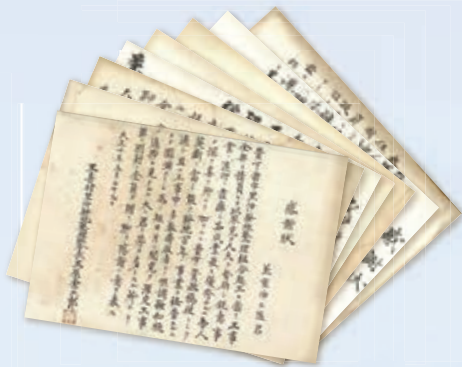
1921.5.29 (大正10年) 里中耕地整理工事 感謝状