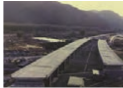
1984-1986 (昭和59年～昭和61年) 山陽自動車道 藤河高架橋工事