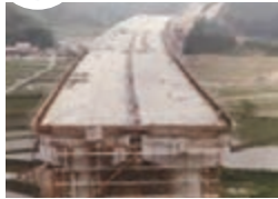
1980-1981 (昭和55年～昭和56年) 中国自動車道 石ヶ谷高架橋工事