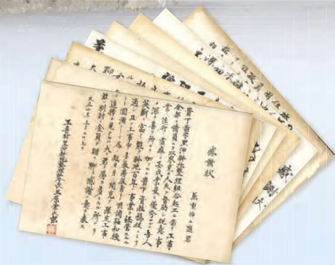
1921.5.29 (大正10年) 里沖耕地整理工事 感謝状