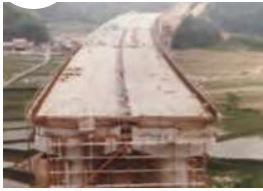
1980-1981 (昭和55年～昭和56年) 中国自動車道 石ヶ谷高架橋工事