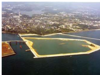
1988-2001 (昭和63年～平成13年) 山口宇部空港滑走路延長(2500m)工事