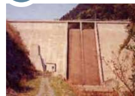
1979-1983 (昭和54年～昭和58年) 山の口ダム建設工事