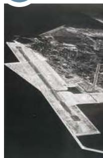
1966 (昭和41年) 空港整備事業