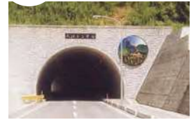
1996-1997 (平成8年～平成9年) 県道柳井周東線道路 (大江トンネル)改良工事