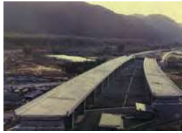
1984-1986 (昭和59年～昭和61年) 山陽自動車道 藤河高架橋工事