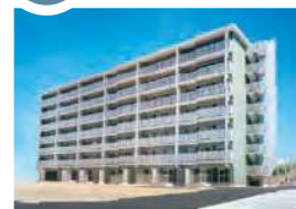
2000 (平成12年) 琴芝県営住宅