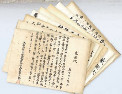
1921.5.29 (大正10年) 里沖耕地整理工事 感謝状