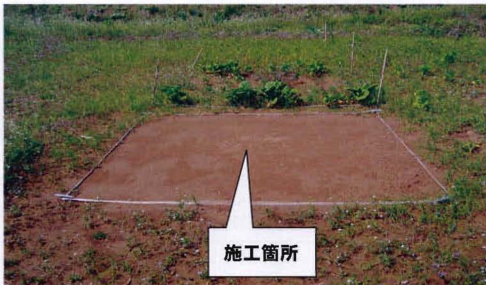
【防草対策区とその周辺】