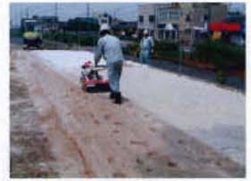
③【混合・散水・再混合】